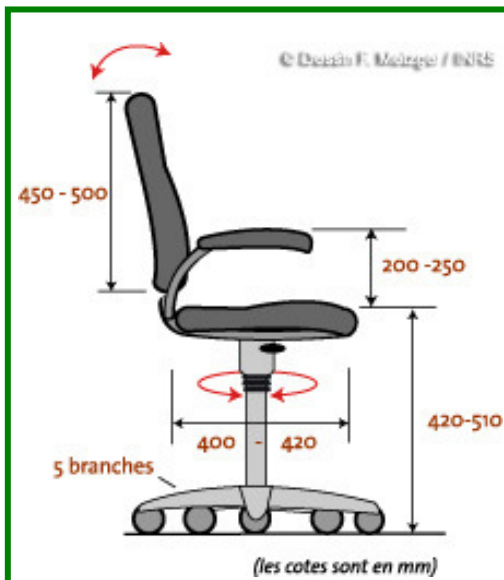
Fig. 2 : Le siège de travail

L'écran : Le travail sur écran pouvant générer de la fatigue visuelle, le choix de l'écran détermine donc l'exposition à ce risque. L'écran plat est aujourd'hui la meilleure alternative. Il se situe à une distance de 50 à 80 cm. Le haut de l'écran doit être à la hauteur du regard de l'utilisateur (Fig. 3).