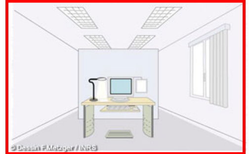
Fig. 1 : Implantation du poste

L'environnement : La surface minimale recommandée est de 10m 2 /occupant. Il est préférable, selon les fréquences d'utilisation, que les équipements bruyants soient installés à l'extérieur du bureau. Autant que possible, placer les écrans perpendiculairement aux fenêtres (Fig. 1). Il est conseillé d'équiper les fenêtres de stores qui permettront de réguler l'intensité lumineuse. L'éclairage de la pièce doit être au minimum de 200 lux et ne pas dépasser 600 lux (l'ASTPB vous propose de réaliser des mesures à votre demande).